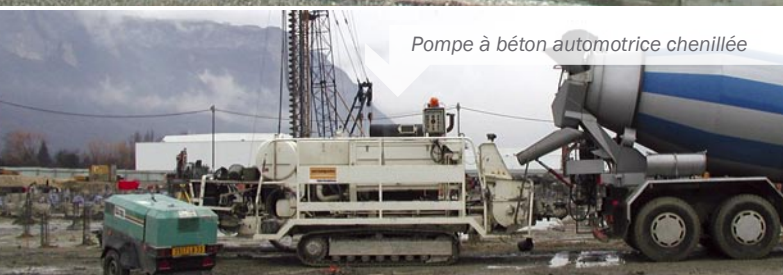
Pompe à béton automotrice chenillée