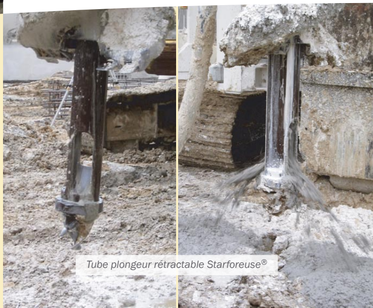
Tube plongeur rétractable Starforeuse®